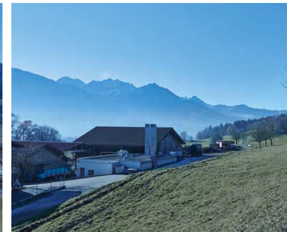
Eine Biogasanlage in Kombination mit einer größeren Photovoltaik-Anlage versorgt 20 Haushalte im Ort mit erneuerbarer Energie.